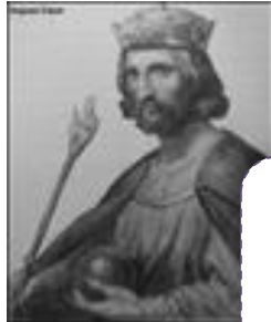
Charles le Simple

L'an 1000. La fin du monde, la peste, le choléra et les famines