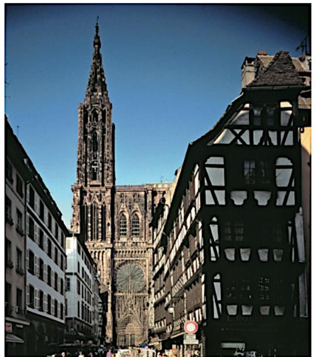
Cathédrale de Strasbourg Date 1439 - Hauteur 151 mètres