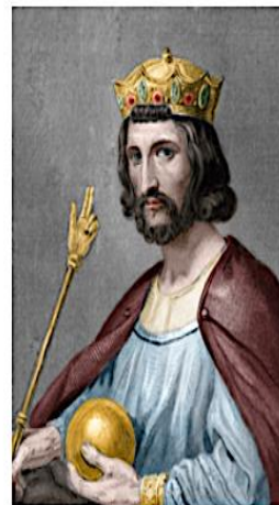
Hugues Capet né en 941