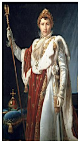
Napoléon né en 1769