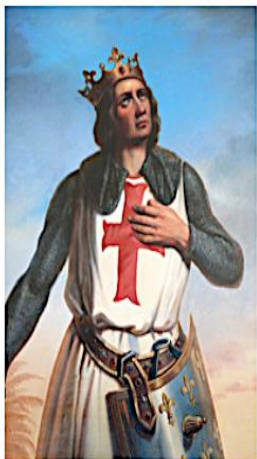
Saint Louis né en 1214