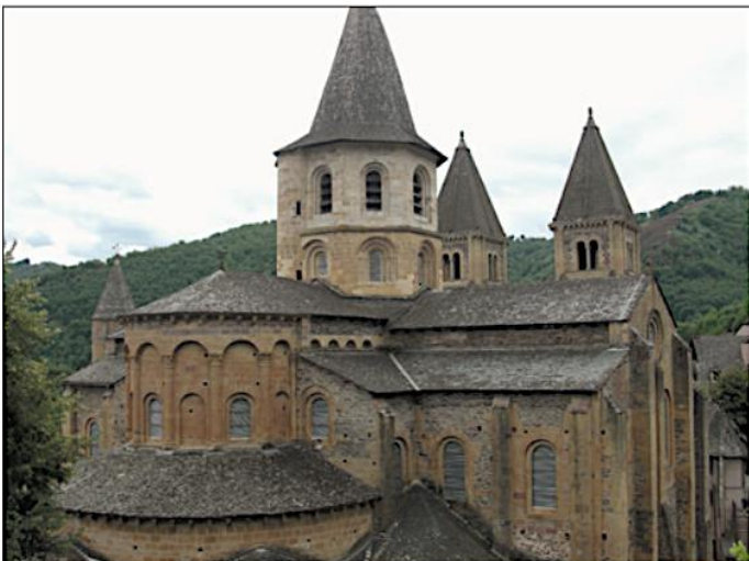
Église de Conques Date 1120 - Hauteur 32 mètres