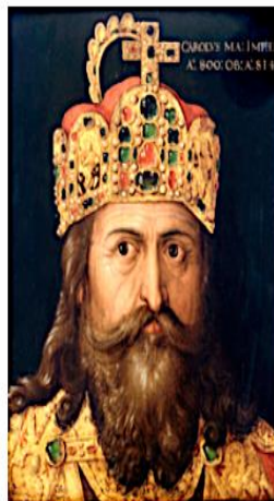
Charlemagne né en 747