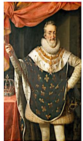
Henri IV né en 1553

1) Qui sont ces cinq personnages ? Qu'est-ce qui te permet de le dire ?